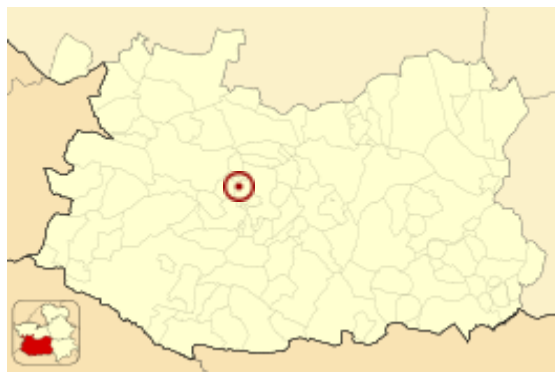
Miguelturra en el mapa de la provincia

Ubicación de Miguelturra en la provincia de Ciudad Real.